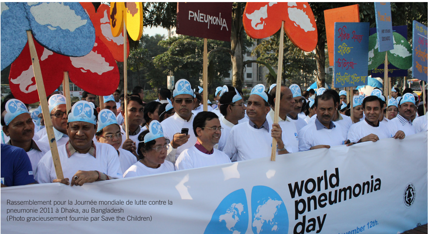
Rassemblement pour la Journée mondiale de lutte contre la pneumonie 2011 à Dhaka, au Bangladesh

Coalition mondiale contre la pneumonie infantile